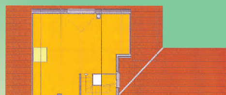
22 P. Bajo Cubierta